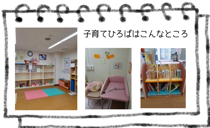
子育てひろばはこんなところ

*健康サポートセンターひろば開室日には、 共育プラザ南小岩の職員が常駐しています。